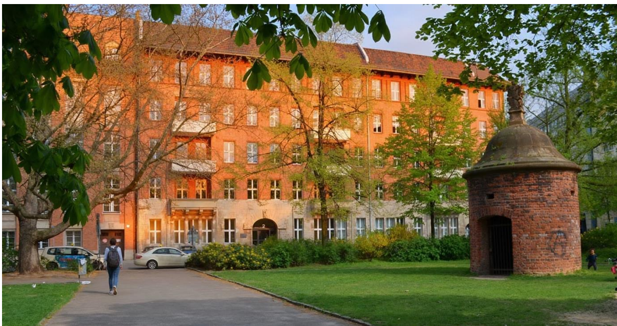
Am Kölnischen Park 2, 10179 Berlin

im Gäste- und Seminarhaus am Klostersee, Zum Strandbad 39 in 14797 Kloster Lehnin www.gaestehaus-amklostersee.de